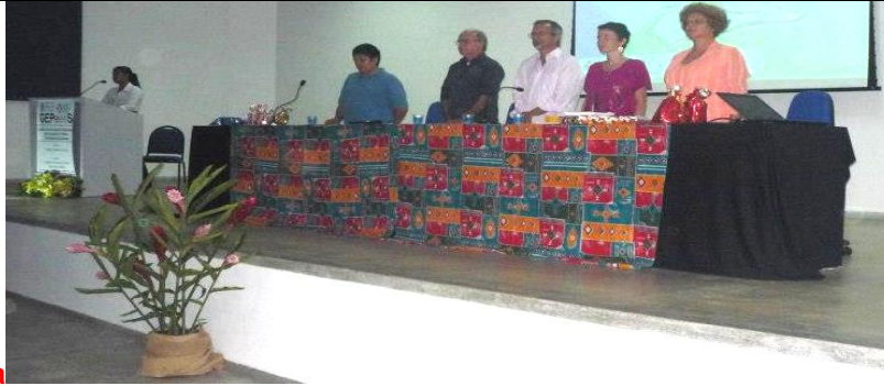
Mesa de abertura