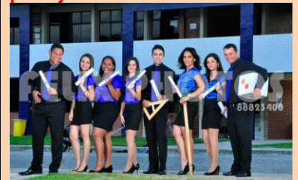
Colação de Grau do CCAE-UFPB. Na foto, graduados em Matemática.