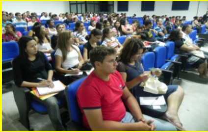
Plenário do II SECAMPO 2012.p.6