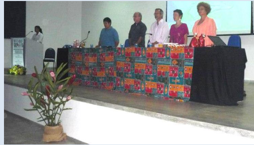
Mesa de abertura do II SECAMPO 2012.

O II SECAMPO 2012 superou as expectativas quanto ao número de participantes e trabalhos inscritos. Foram realizadas 02 (duas) conferências, 9 (nove) GT's, 05 (cinco) oficinas, tendo 290 (duzentos e noventa) inscrições, 90 (noventa) trabalhos, 17 (dezesete) banners, além do lançamento de 06 (seis) títulos na feira de livros e uma excelente caminhada eco pedagógica na Reserva Biológica Guaribas – Mamanguape -PB. Intensa participação de estudantes universitários, professores da UFPB e de Rede Pública do Vale do Mamanguape. Foi registrado a presença de Professores e Estudantes provenientes das universidades de Minas Gerais, Bahia, Ceará, Rio Grande do Norte, Piauí, João Pessoa, Guarabira, Campina Grande, Cajazeiras e Souza – PB. Veja ampla cobertura p. 5, 6, 7, 8, 9, 10, 11, 12 e 13.