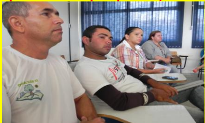
Educadores apresentam 90 trabalhos no II SECAMPO 2012.p.6