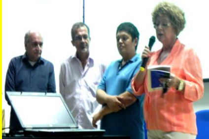
Livros lançados no II SECAMPO.p.12