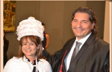
Posse da Nova Reitora foi Concorrida. Pró-Reitores elaboram planejamentos. P.2.

A oficina de Sarau Pedagógico encantou a todos: "Educação se faz com arte, diálogo, corpo, mente, movimento, envolvimento" , disse um participante empolgado. Págs.: 9, 10 e 11.