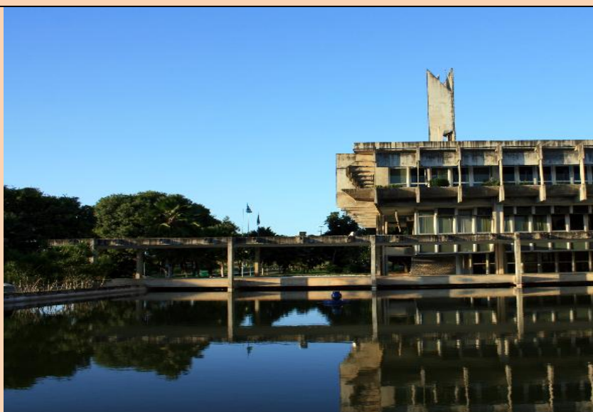
Reitoria da UFRN

Feira agroecológica estará fornecendo alimentação durante toda a SBPC. Haverá a Ecotrilha nas Dunas de Maracajaú entre os dias 27 e 29 de julho, com visita ao Proteção Ambiental dos Recifes de Corais e farão caminhadas por dunas costeiras e lagoas interdunas.