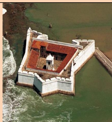
Forte dos Reis Magos – Natal - RN