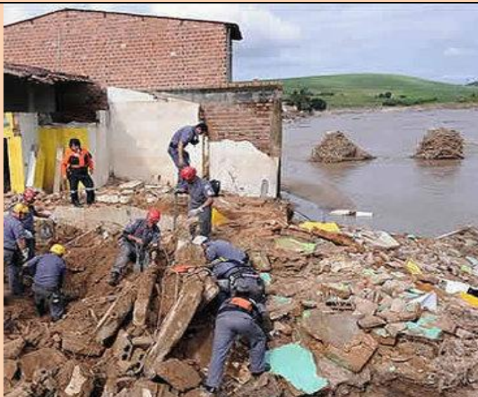
Ação dos bombeiros

O Ministério da Saúde enviou mais de 200 mil doses de vacinas para Alagoas. As doses de imunização devem servir para a prevenção de doenças, como a hepatite A, rotavírus, e tétano. Foram enviados 13 mil diluentes (substâncias usadas para diluir as vacinas) e mil unidades de soros antitetânicos.