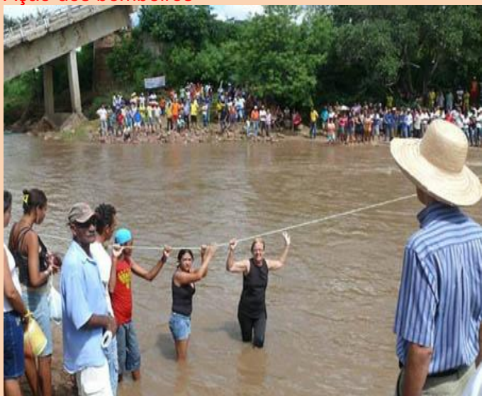
A solidariedade, uma marca dos povos