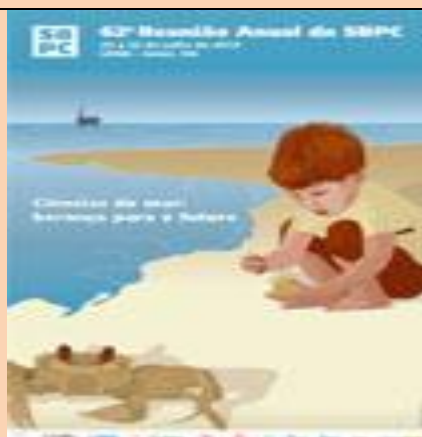
Cartaz revela tema SBPC