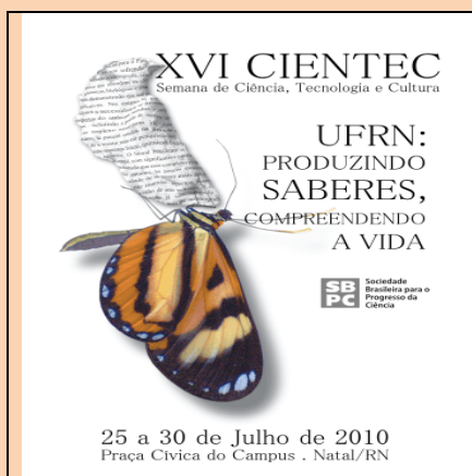
Cientec: 16 anos de exposição